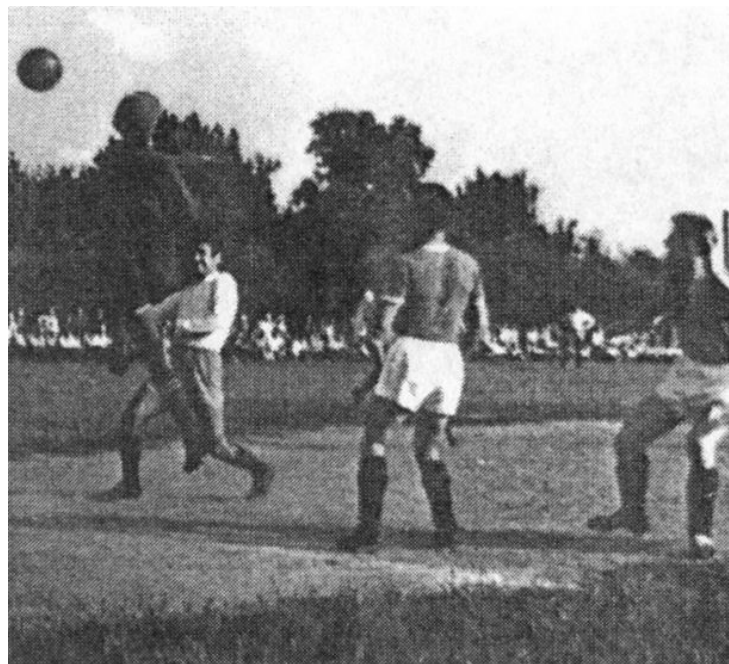
Момент встречи полонских футболистов с футболистами из г.Барановка 1961г. Счет 3:2 Архивное фото

В 1961-1962 годах стадион отремонтировали. Были в Полонном и другие стадионы, в разных частях города. На них играли юноши из близлежащих районов города, а также команды, сформированные при местном фарфоровом заводе (ФК «Авангард»), колхозе им. Щорса (ФК «Колхозник»), ФК «Спартак», состоявшая из игроков разных организаций, школьников.