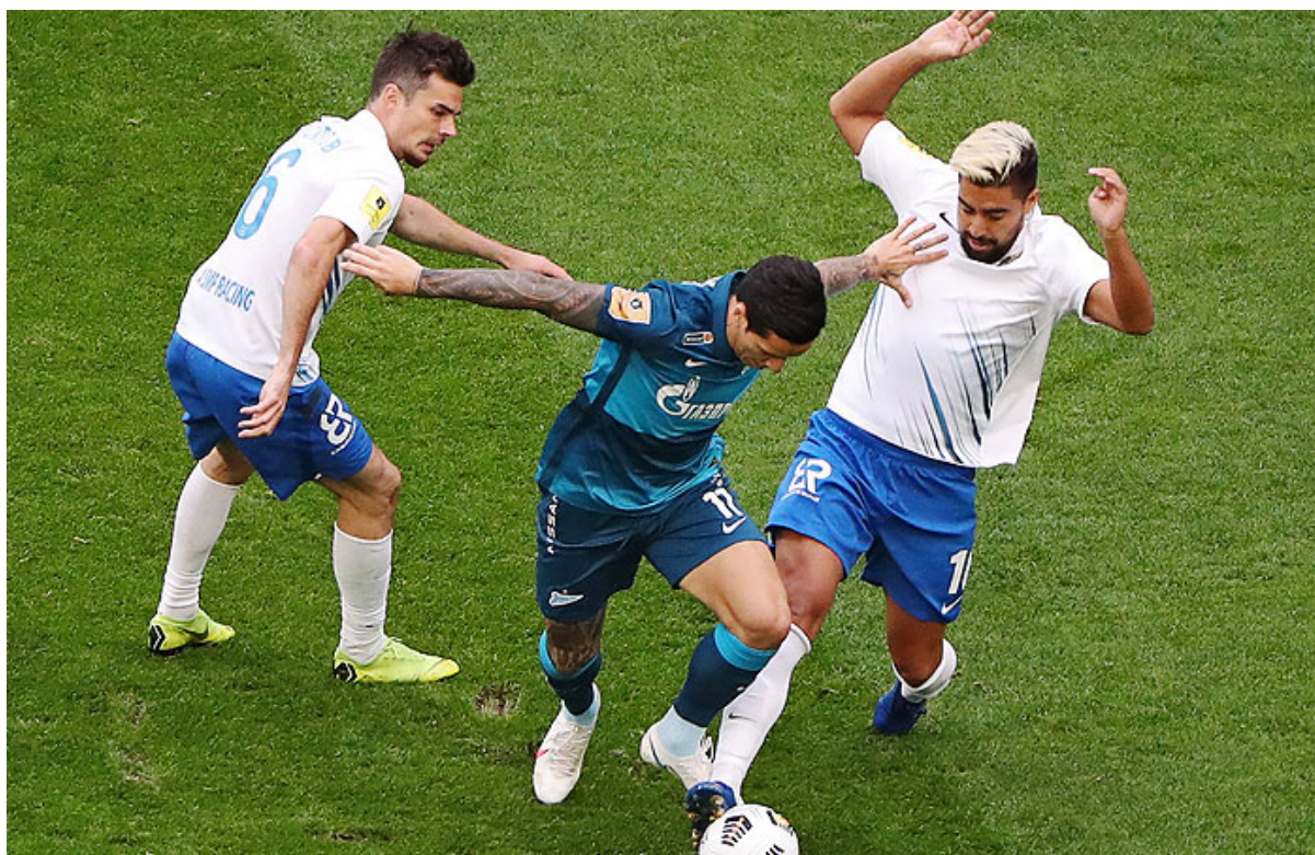
«Зенит» – «Сочи»

предприятие «Газпром добыча Оренбург», на 99% принадлежащее обществу с ограниченной ответственностью «Газпром переработка». Ну а оно, в свою очередь, тоже входит в общество большого «Газпрома». Получается, что это уже третий клуб, так или иначе относящийся к одной вселенной.