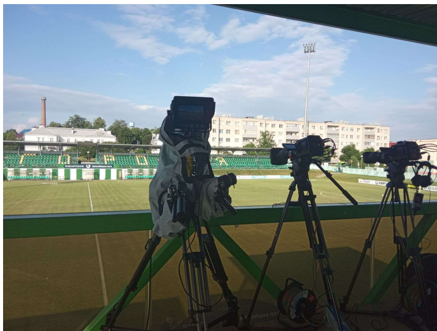
Позиция операторов в Городец

Обычно у комментатора есть монитор, на котором можно увидеть картинку трансляции с повторами ключевых моментов. Но иногда приходится работать без дополнительной картинки. Тогда комментатору приходится работать в тех же условиях, в которых находится обычный болельщик. И в таких условиях важно сохранять концентрацию, чтобы ничего не упустить.